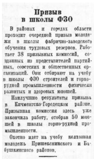
Призыв в школы ФЗО (Красный Север. 1949. № 46. С. 1)

сии!», «Будешь мастером!», «Юноши и девушки! Поможем создать мощные трудовые резервы Советского государства. Поступайте в ремесленные, железнодорожные училища и школы ФЗО!», «Становитесь квалифицированными рабочими социалистической промышленности!» и т.д.