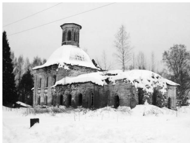
Покровская Ерогодская церковь. Начало XXI в.

А в даях архангельских, за Двиной, Вдоль Содонги-речки – мои луга! И лес за лугами – сплошной стеной Шумит, и растет, и цветет века.