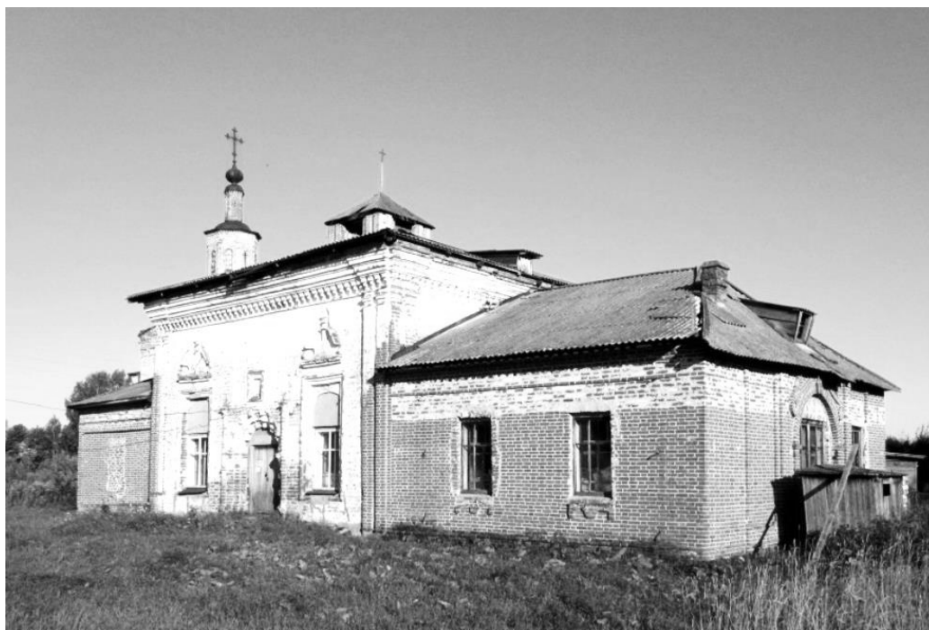
Вознесенская Кивокурская церковь.