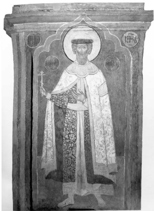
Святой Александр Невский. Фреска, 1666 год, Москва, Кремль, Архангельский собор, роспись юго-восточного столпа

В 1572 г. к лику святых был причислен дед князя Глеба Белозерского (по линии матери Марии Михайловны († 1271)) Черниговский князь Михаил Всеволодович, казненный по приказу Батые за отказ поклониться языческим идолам в 1245 г.