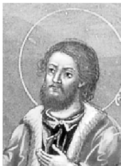
Святой благоверный князь Василий Ростовский. Икона. XVIII век

В свое время (точно даты не известно) был также прославлен в лике святых отец Глеба Васильковича и двоюродный брат Александра Невского Ростовский князь Василько Константинович.