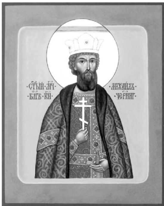
Святой мученик благоверный князь Михаил Черниговский

В 1572 г. к лику святых был причислен дед князя Глеба Белозерского (по линии матери Марии Михайловны († 1271)) Черниговский князь Михаил Всеволодович, казненный по приказу Батые за отказ поклониться языческим идолам в 1245 г.