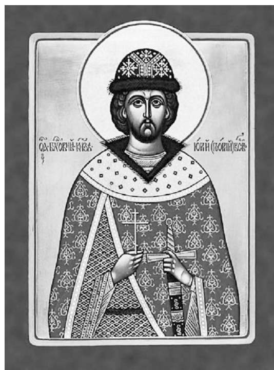
Святой Благоверный князь Георгий (Юрий) Всеволодович Владимирский

дядя Александра Невского и отца князя Глеба Белозерского, Константина Всеволодовича, погибший в 1238 г. в борьбе с татарами на реке Сить.