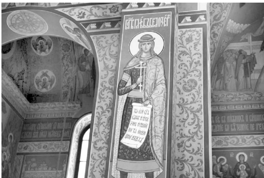
Святой благоверный князь Глеб Белозерский. Настенная роспись. Кафедральный собор преподобных Афанасия и Феодосия Череповецких, г. Череповец

В XIX–XX вв. в национальном сознании образы предков, храбро противостоящих недругам, в особенности образ святого Александра Невского, стали превращаться в героический символ народной, российской истории. В годы Великой Отечественной войны победы Александра Невского над немецкими рыцарями