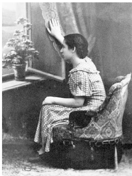
Снимок, сделанный А. Бамом в ателье Гончарука. На снимке – сестра фотографа

Сам Гончарук предпочитал природный фон: чаще всего снимал проходящих именно на нем. Баму же нравилось окно. Причем он делал не просто стандартные портреты сидящих у окна людей, а предлагал позирующему разыграть сценку: кто-то открывал нарисованное окно, кто-то выглядывал в него, кто-то поливал стоящий на нарисованном окне цветок. – «Я не жалел времени – всегда придумывал что-нибудь интересное».