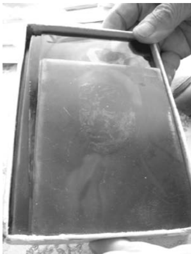
Отретушированный негатив

битое». Свет, бывает, складки на лице делает резкими, углубленными – вот их-то и надо смягчать».