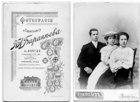
Неизвестные. Фотография ателье К. Баранеева

Здесь же, совсем рядом, на улице Ленина (тогда – Кирилловской), когда-то работала другая известная мастерская – фотография Ксенофонта Баранеева. Правда, здание этого известнейшего вологодского ателье конца XIX – начала XX века не сохранилось, сейчас место его пустует: как ни странно, ничего нового после сноса здесь построено не было.