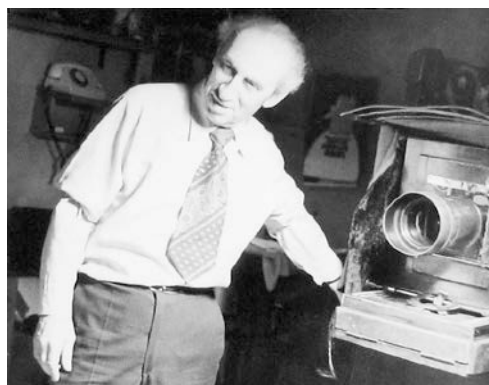
А.Н. Бам.

«Начинал я в 38-м году на Старом рынке. У церкви был фотопавильон, вокруг – ряды деревянного рынка: навесы, прилавки; а напротив, через дорогу – толкучка, где люди продавали свои старые вещи. Фотопавильон был маленький, деревянный. Крыша в нем была стеклянная, дневной свет. Следующий павильон, тоже деревянный, но побольше, поставили чуть позже за углом, там, где сейчас ничего нет, только забор. И он тоже был со стеклянной крышей и с дневным светом».