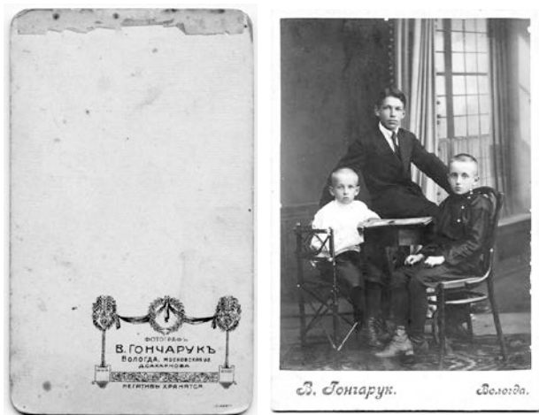
Неизвестные.