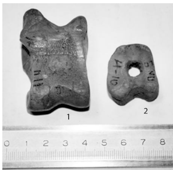
Рис. 2. Костные остатки КРС: 1 – таранная кость, 2 – фрагмент фаланги

(рис. 2). На некоторых фрагментах костей видны следы зубов собак и мелких грызунов.