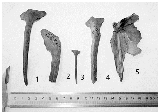
Рис. 5. Костные остатки рыб: 1–4 – осетровые (14 пласт, 12 пласт, б/н, 9 пласт), 5 – фрагмент черепа лососевых (белорыбица или нельма)

Наибольшее количество костей (11 экз.) принадлежит щуке (39%). Осетровым принадлежит 7 костных остатков (24%). По имеющимся фрагментам трудно сказать, какому виду крупных осетровых принадлежат кости (фото 3). 5 костных остатков (17%) принадлежат рыбам из семейства карповых: 2 костных фрагмента леща, одна кость карася или карпа, одна кость принадлежит голавлю или язю, одна кость – ближе, чем карповые, не определима. Налиму принадлежит 2 кости (7%). Сиговые представлены одной костью (3%), скорее всего, эта кость принадлежит белорыбице или нельме. Обнаружен позвонок, принадлежащий атлантическому лососю (3%). Два фрагмента кости не удалось определить ближе, чем принадлежащие рыбам (7%). Большая часть видового состава обычна для реки Вологды и близлежащих рек бассейна реки Сухоны. В то же время уже в ранних пластах присутствуют кости привозной рыбы – осетровые, ближайшее место вылова которых бассейн р. Шексны. Русский осетр (вместе с белугой и севрюгой) до строительства волжских гидроузлов иногда поднимался довольно высоко и встречался в верхних притоках Волги – рр. Мологе и Шексне [5; 9] (рис. 5).