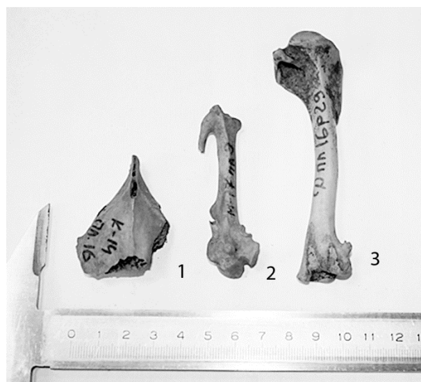
Рис. 6. Костные остатки птиц: 1 – грудина глухаря (16 пласт), 2 – пряжка глухаря (8 пласт), 3 – плечевая кость представителя семейства врановые (16 пласт)

Общее количество костей птиц в сборах составило 234 экземпляра. В общей сложности диагностировано четыре вида птиц из двух отрядов (гусеобразные и курообразные), среди которых представлены как домашние, так и дикие (рис. 6; табл. 6). Помимо этих видов, отмечена кость представителя отряда воробьинообразные (сем. Corvidae ), которую до вида определить не удалось. Часть костей (84 экземпляра, 35,9%) не удалось определить ближе, чем до класса. Больше половины определяемых костей (91 экз., 60,6%) приходится на домашнюю курицу. Определить, принадлежат ли остатки серого гуся и кряквы к домашней или к диким формам не удалось. Для определения видовой принадлежности была использована эталонная коллекция костных остатков птиц и рыб Института экологии растений и животных УрО РАН (г. Екатеринбург) (рис. 6).