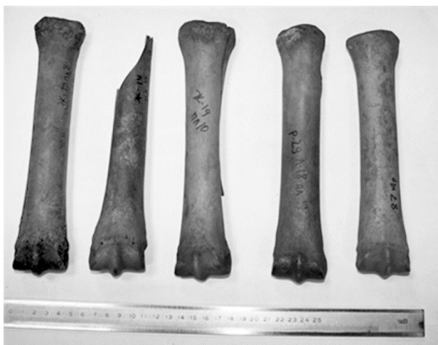
Рис. 4. Метакарпальные кости лошади (пласты: 8, 17, 10, 17, б/н – см. слева направо)

«низкорослых» и «среднерослых» (высотой от 132 до 138,4 см) с длиной пясти от 206,0 до 216,0 мм и индексами ширины диафиза пясти от 13,3 до 14,8% (также тонконогие и крайнетонконогие). По сравнению с материалами раскопок древнерусских городов видно преобладание тонконогих и крайнетонконогих лошадей. Для суммированного материала из раскопок Новгорода, Москвы, Гродно, Старой Ладogi и Пскова было характерно присутствие почти 77% тонконогих и полутонконогих лошадей [14]. Однако для полноценного сравнения материалов из раскопок в Вологде явно недостаточно.